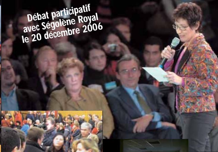
Débat participatif avec Ségolène Royal le 20 décembre 2006