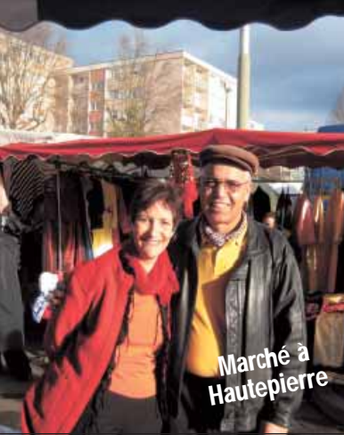
Marché à Hautepierre