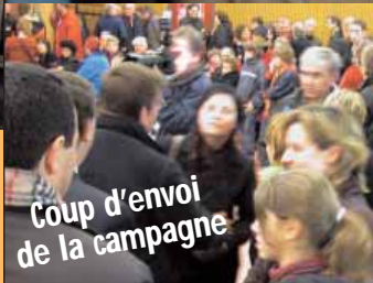
Coup d'envoi de la campagne